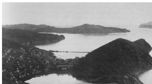
Рис. 1. Петропавловск-Камчатский в начале XX века [Hulten, 1974].