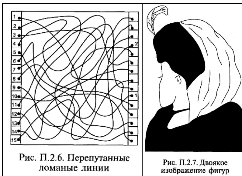
Рис. П.2.6. Перепутанные ломаные линии