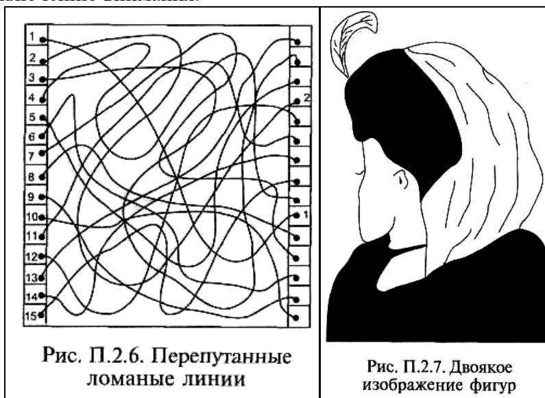
Рис. П.2.6. Перепутанные ломаные линии

Далее испытуемым предъявляют рисунки с двояким изображением, например «портрет» молодой и старой женщины (рис. П.2.7). По секундомеру исследователи отмечают время восприятия и осознания испытуемым обоих образов. О степени переключаемости внимания судят по количеству секунд, затраченных на опознание обоих образов: чем быстрее человек увидит оба образа, тем больше у него выражена способность к переключению внимания.