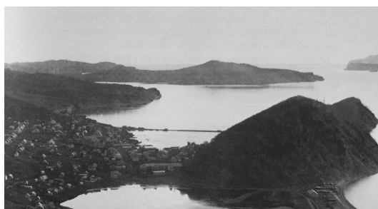
Рис. 1. Петропавловск-Камчатский в начале XX века [Hulten, 1974].