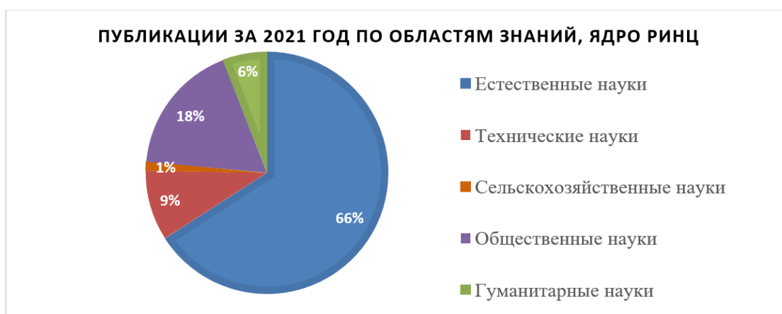
График 2. Публикации за 2021 год по областям знаний в ядре РИНЦ

По данным РИНЦ за 2021 год, областями с самым большим числом публикаций являются естественные и точные науки (66%), технические науки (9%), сельскохозяйственные науки (1%), общественные науки (18%), гуманитарные науки (6%). Распределение этих публикаций изображено на Графике 2.