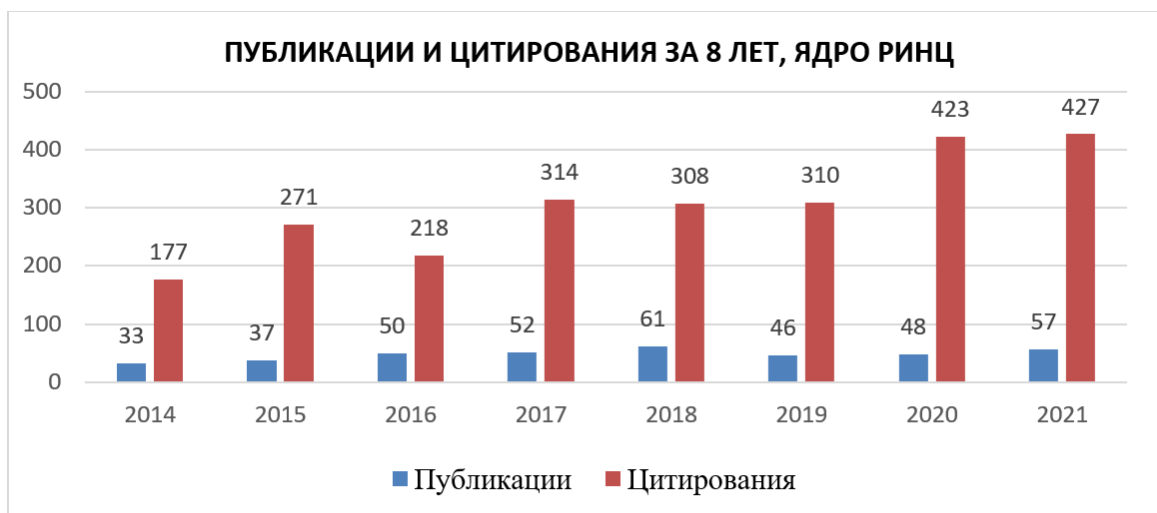
График 1. Публикации и цитирования за 8 лет в ядре РИНЦ

По данным РИНЦ за 2021 год, областями с самым большим числом публикаций являются естественные и точные науки (66%), технические науки (9%), сельскохозяйственные науки (1%), общественные науки (18%), гуманитарные науки (6%). Распределение этих публикаций изображено на Графике 2.